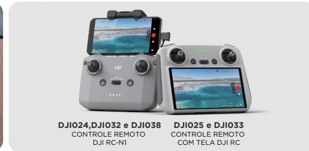
DJI024, DJI032 e DJI038 CONTROLE REMOTO DJI RC-N1