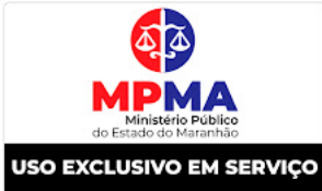
imagem MPMA.jpeg 102K

Coordenadoria de Administração - CAD Procuradoria Geral de Justiça - PGJ/MA (98) 3219-1660/ 1661/ 1662