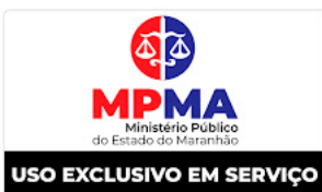
imagem MPMA.jpeg 102K